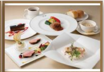
食事のコース料理 (イメージ)