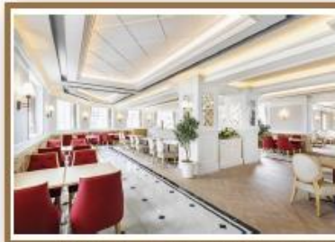
宝塚ホテル ビュッフェ&カフェレストラン 「アンサンプル」