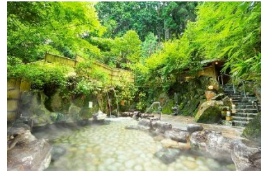
湯村温泉 三好屋 森林露天風呂

VIP TICKET 1枚持参で、 グループ内(中学生以上)1名様当り1,000円引きのチケットです。 *土曜日、12/28~1/3、1/8(日)は除外日ですのでご注意ください。 *齊木別館・矢田屋松濤園は3,000円引きとなり、除外日はありません。