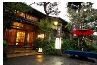
渡月亭別館 松風閣