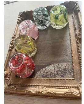
ハーバリウムのペン立て

*申込多数の場合は抽選となります。 *申込締切後のキャンセル及び当日ご欠席の場合も参加費は返金できませんのでご注意ください。