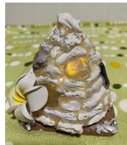
サンゴのランプシェード

開催日時 8月4日（日）10:00～12:00 ①ハーバリウムのペン立て&ボールペン ②サンゴのランプシェード&写真立て 場所 羽曳野市市民会館 2F 第1・第2会議室 （近鉄南大阪線「古市」駅下車 徒歩5分） （駐車場はありますが高さ制限と台数に限りがあります。） 電話番号 072-958-2311 講師 Mackey Miley 参加費 1,500円（材料費込み） 募集人数 7市合計 各12名（最少催行 各2名） 申込期間 7月19日（金）まで受付します。