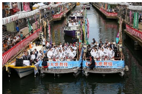
令和5年「七月大歌舞伎」船乗り込みより

松竹座の、夏の風物詩となっている「七月大歌舞伎」。開場101年目を迎える今年の公演も、是非ご期待ください。