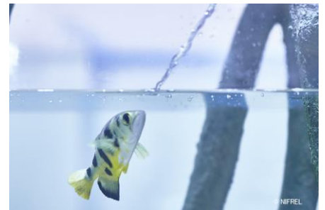
テッポウウオの給餌