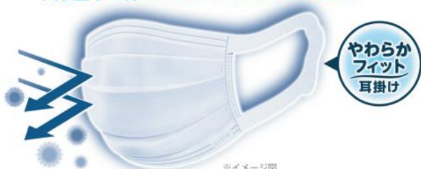
①サージカルマスク スマートタイプ

米国規格 ASTM F2100-19 の 試験基準を満たしたサージカルタイプのマスク