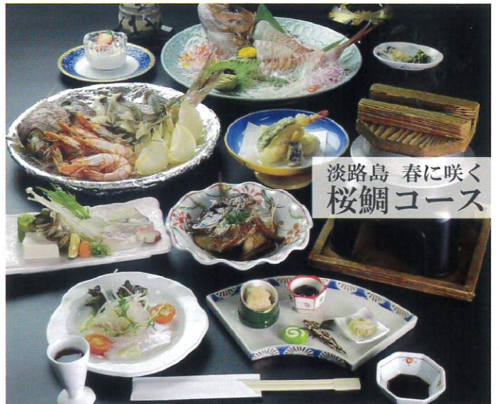
淡路島 春に咲く 桜鯛コース