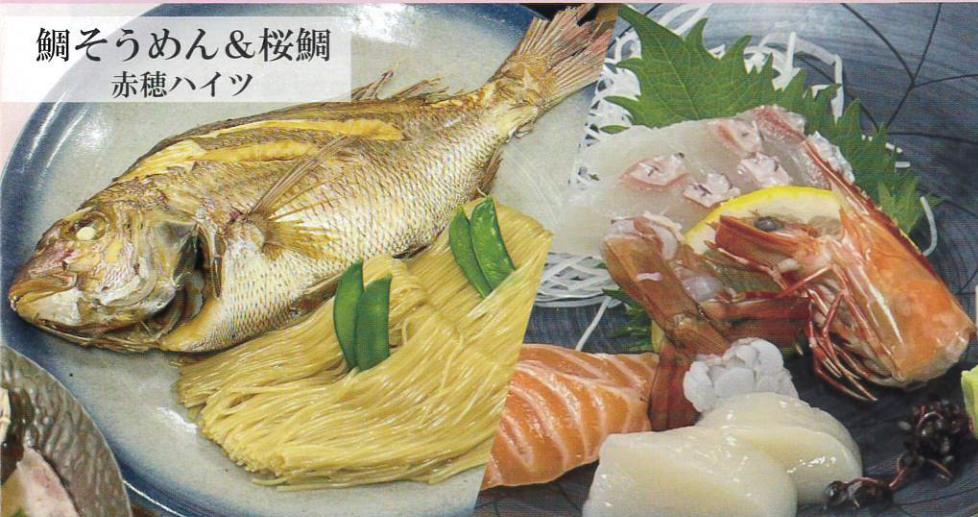
鯛そうめん&桜鯛 赤穂ハイツ