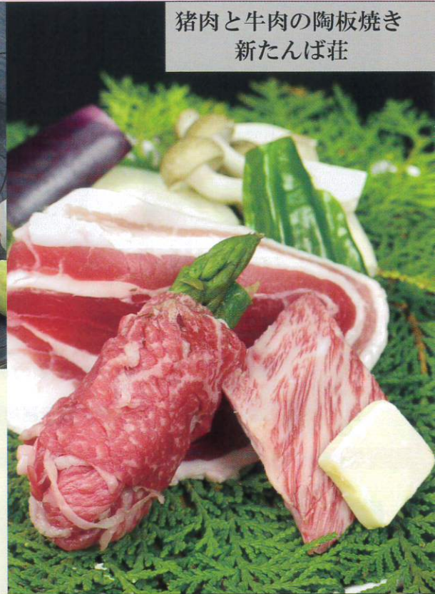
猪肉と牛肉の陶板焼き 新たんば荘