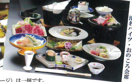
赤穂ハイツ・義士会席