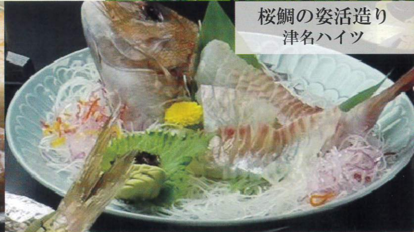
桜鯛の姿活造り 津名ハイツ