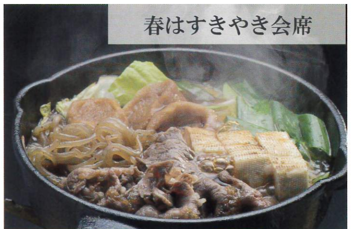
春はすきやき会席