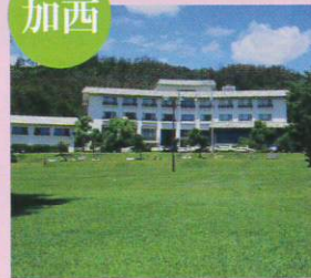
いこいの村はりま